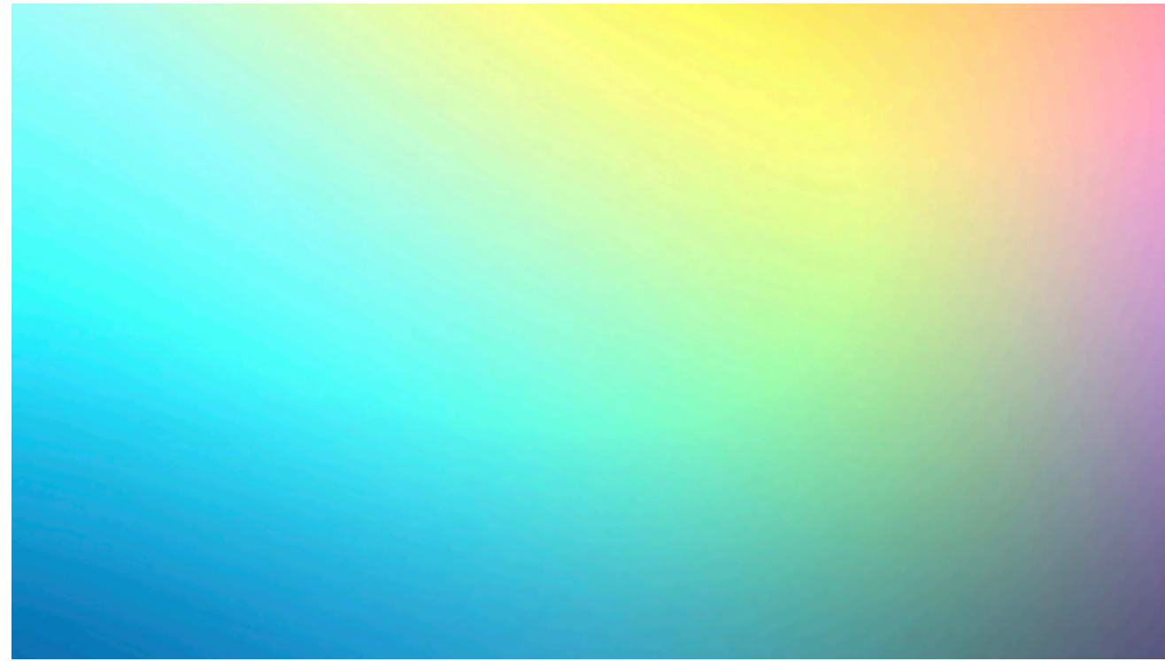
Abstract Visuals (Узбекистан)

перемены, объединяя экспертов, партнеров и поставщиков в профессиональное