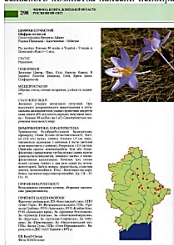
Рис. 45. Характеристика вида растений (структура)

Красная книга Донецкой области: растительный мир. Растительный мир Донетчины богат и уникален. Но интенсивное развитие промышленности и сельского хозяйства нанесли непоправимый урон флоре нашего края. Поэтому сохранение разнообразия флоры очень актуально для региона.