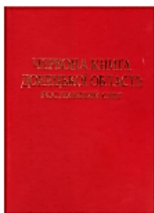
Рис. 44. Красная книга Донецкой области: Растительный мир (обложка)

Восстановленные – виды, численность которых, благодаря принятым мерам относительно их охраны, не вызывает беспокойства, однако требуют постоянного контроля.