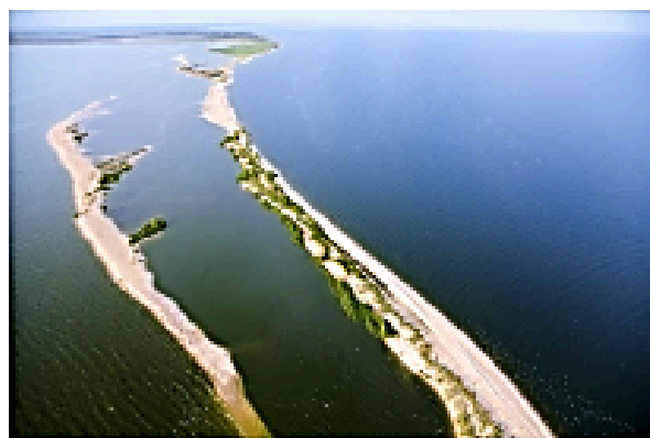
Рис. 43. Великоанадольский лес