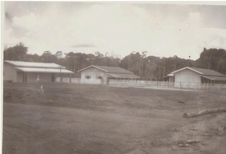
Fotografia 7 – Escola Estadual de 1º. Grau Manoel Soares Campos