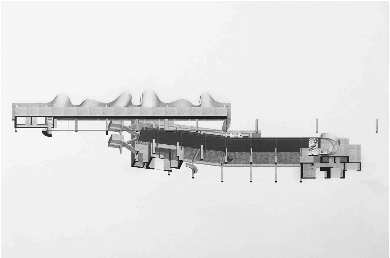
인제 스마트복합센터 리모델링