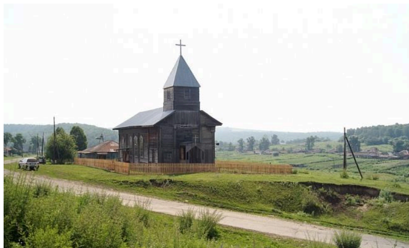
с. Верхний Суэтук. Кирха.

С начала XIX в. в Западной Сибири в 180 верстах от г. Омска существовала лютеранская колония Рыжкова. Она служила сборным пунктом для лиц евангелическо-лютеранского исповедания, ссылаемых «за неважные» преступления (воровство, драки и др.) в Западную Сибирь. Здесь совместно проживали финны, эсты, латыши. Вскоре в колонии обнаружился недостаток земли, и