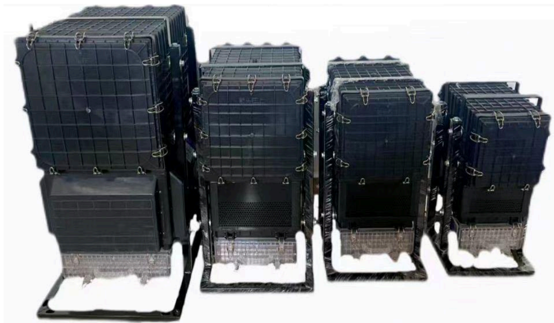
Циклонная система Тип 4