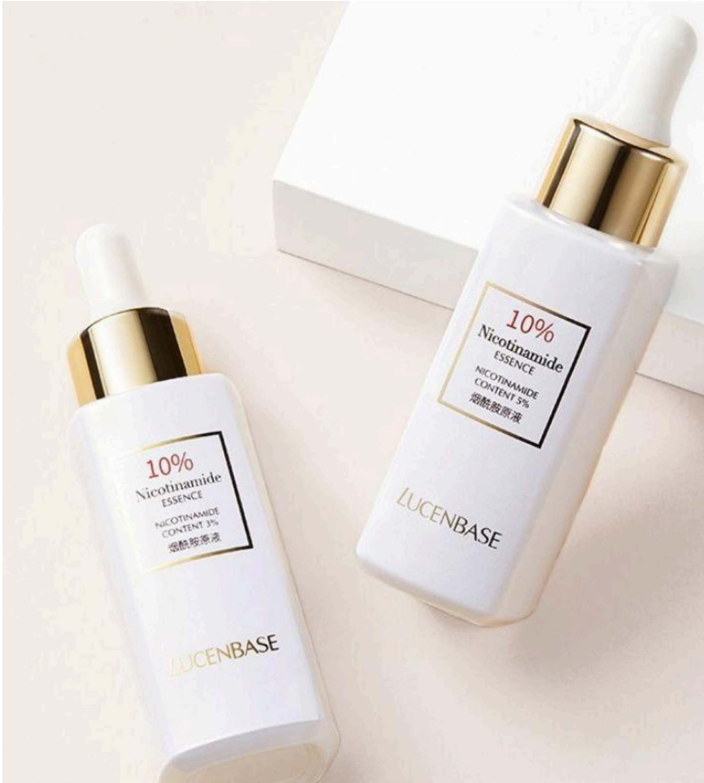
Lucenbase là một thương hiệu mỹ phẩm đến từ Trung Quốc đại lục. Khi mà thời gian gần đây, cái tên Lucenbase đã không còn quá xa lạ với người dùng, bởi khả năng gây ấn tượng cực kỳ