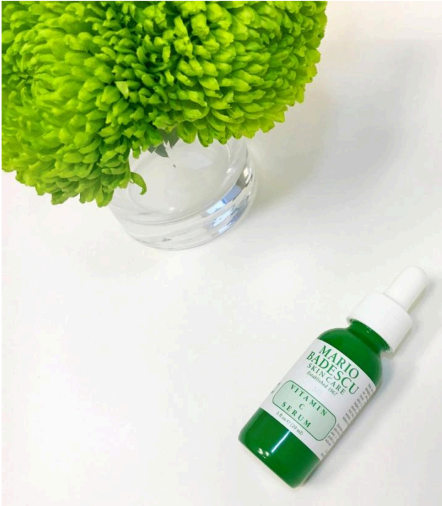
Thương hiệu Mario Badescu