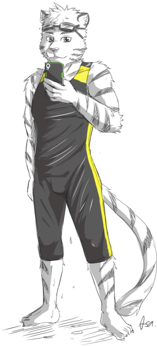
正式獸設(另有差分放在Bluesky和嘍浪) by天狼