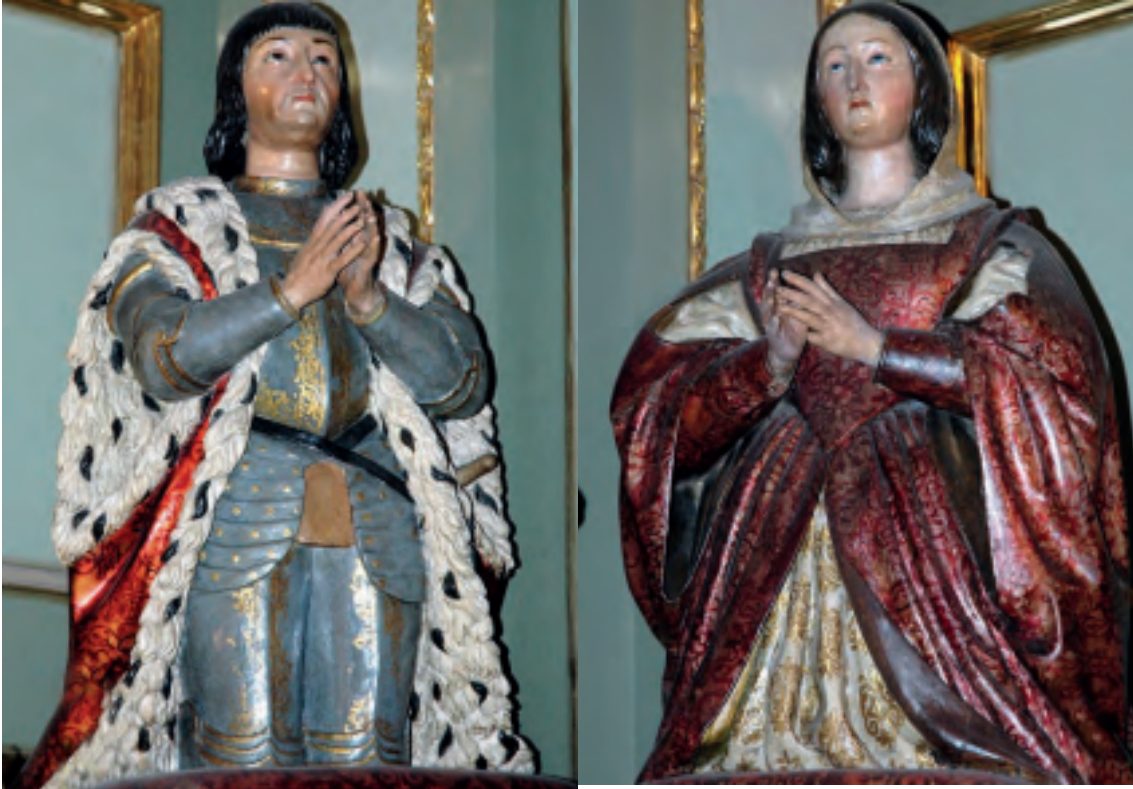
Bustos de los Reyes Católicos en la Catedral de