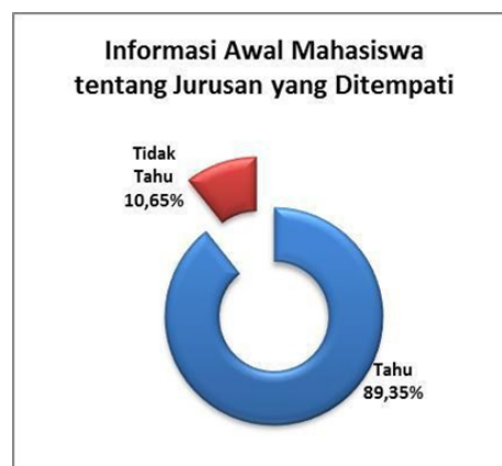
Grafik 1. Judul grafik