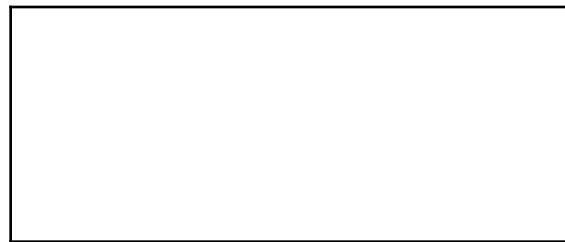
Diagram/Graph/Image X: Title

Each graph, diagram, and image must also be accompanied by a sequential number and caption in italics at the bottom.