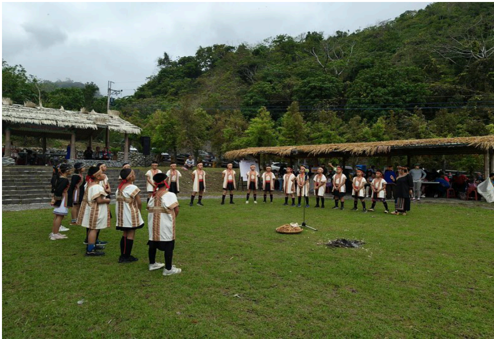
足球隊訓練照片：球場成為孩子學習規則、合作與穩定情緒的地方。