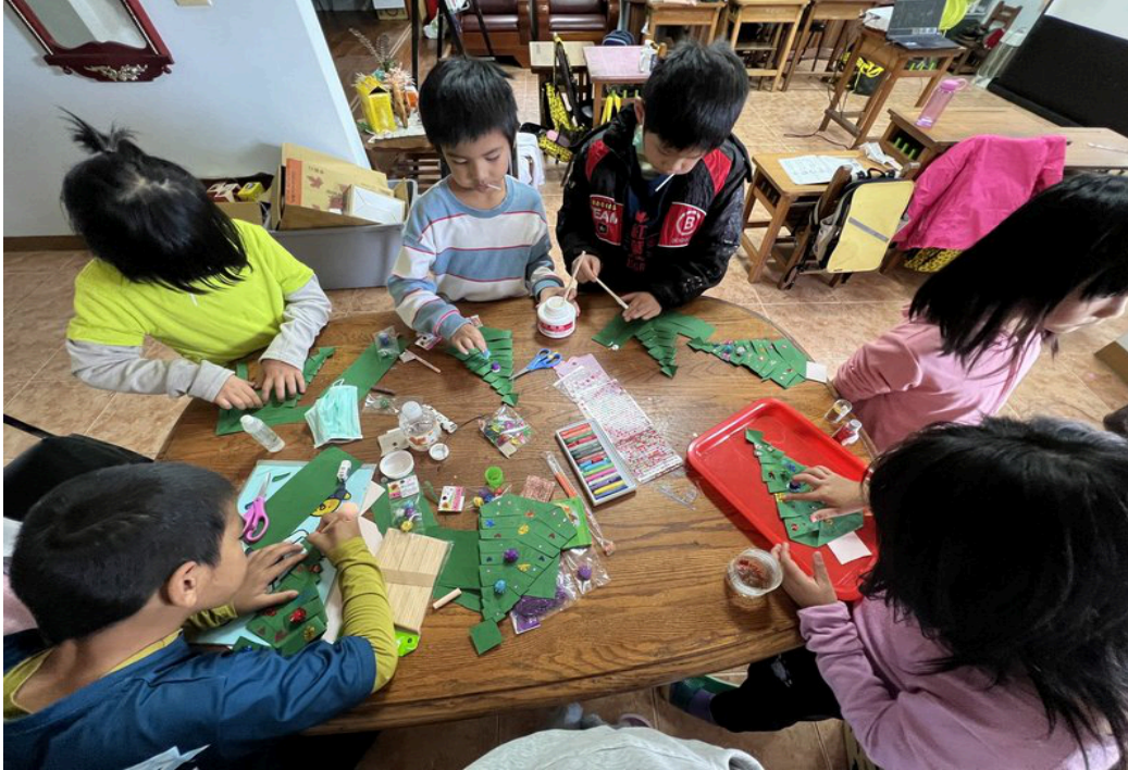
PASIKAU 足球隊孩子在球場上奔跑訓練；照片擷取自所選結案資料。

本報告依據所選結案報告、資金用途資料、PASIKAU 足球隊計畫書與公開網站資訊彙整，並以 SROI (Social Return on Investment, 社會投資報酬率) 作為簡化分析框架。報告目的不是以單一數字取代孩子的真實改變，而是讓捐款人看見：每一筆資源如何轉化為課輔陪伴、運動訓練、家庭連結與部落凝聚。