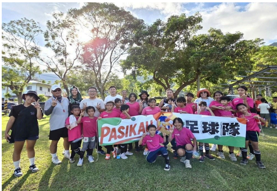
部落服務照片：巴喜告的社區照顧工作不只是一項活動，而是長期陪伴。

臺東縣巴喜告原住民關懷協會成立於 2013 年，秉持「雙福服務、全人關懷」理念，服務內容包含延平原家中心、婦幼庇護、社區防暴、幸福巴士、兒少關顧與 PASIKAU 足球隊等。公開網站亦揭露協會曾獲社區防暴與原鄉服務相關肯定，顯示其在地服務能量與社會信任基礎。