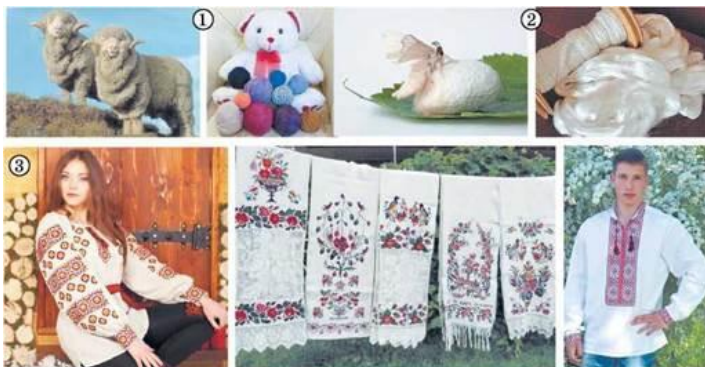
Рис. 31.1. Природні волокна та вироби з них. Вовна (1) і натуральний шовк (2) - поліаміди. Традиційно в Україні вишиванки та рушники виготовляли з домотканих тканин на основі лляних і конопляних волокон (3)

Волокна - матеріали, що складаються з непрядених ниток або довгих тонких відрізків нитки. Це гнучкі утворення з дуже малим (порівняно з довжиною) поперечним перерізом. З курсу хімії основної школи ви вже знаєте, яка природа бавовняних і лляних волокон, а також вовни й шовку (рис. 31.1). Це приклади натуральних волокон.