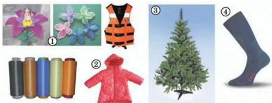
Рис. 31.2. Вироби із синтетичних волокон. 1. І декоративну квітку, і метеликів, і рятівний жилет виготовлено з капрону. 2. Поліестер: нитки та верхній одяг 3. Ялинку, глицю якої виготовлено з розпушеної полівінілхлоридної ниті, не відрізнити від справжньої. 4. Поліпропіленове волокно у складі шкарпеток - запорука сухості та комфорту

Синтетичні волокна виробляють з полімерів переважно прядінням з розплаву. За цією технологією добувають волокна з поліаміду (капрон, найлон), поліестерів, поліетилену, поліпропілену тощо (рис. 31.2).