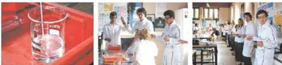
Рис. 31.3. Витягування ниток зі смоли капрону

Пересвідчіться за рисунком 31.3, що і в лабораторних умовах з розплаву капрону (поліаміду) можна витягнути довжелезну нитку.