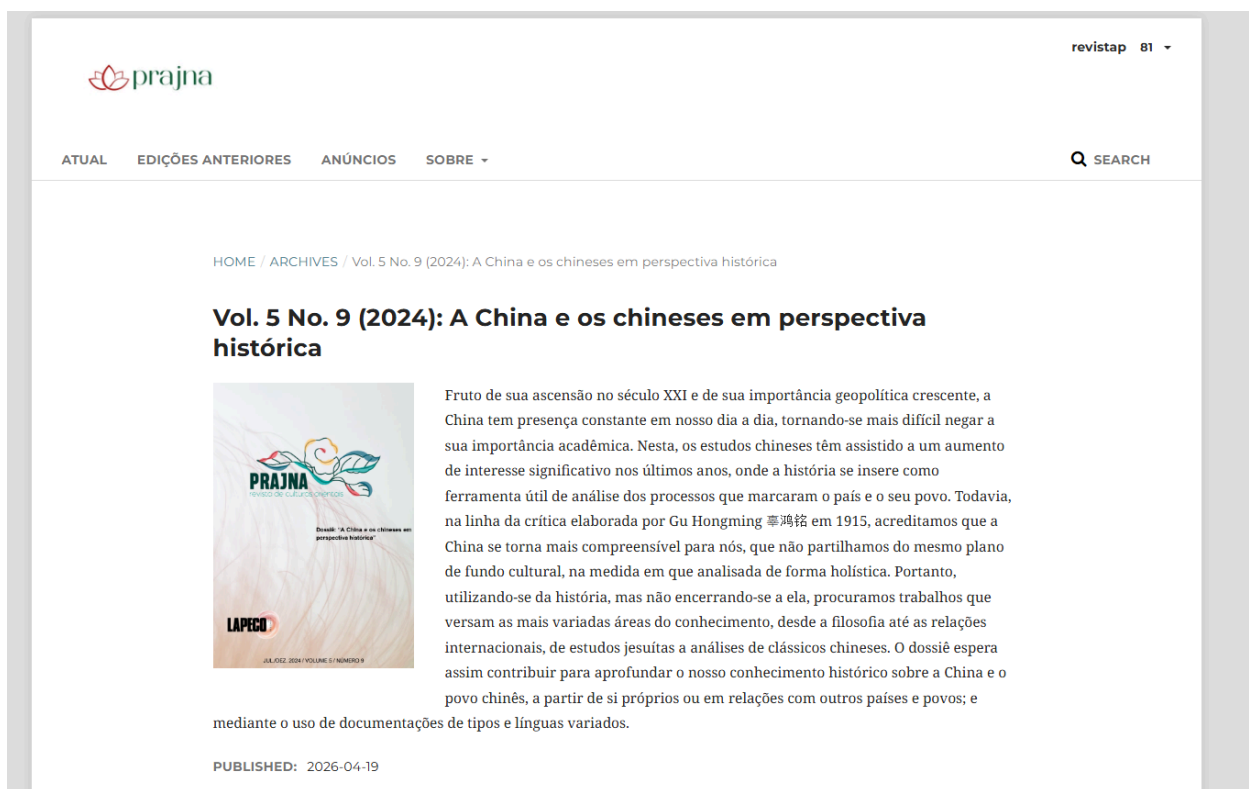
Figura 1 – Site da Revista Prajna.

Fonte: Print do site da revista, na parte "atual" (Prajna, 2026).