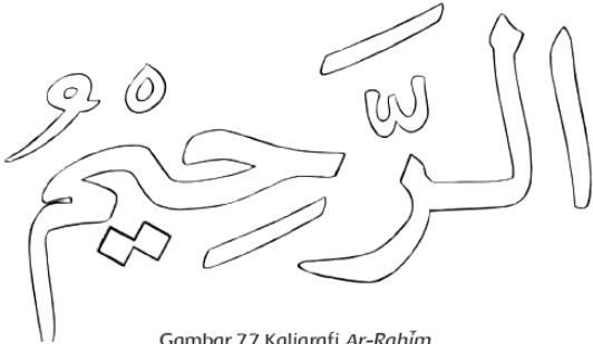
Gambar 7.7 Kaligrafi Ar-Rahim