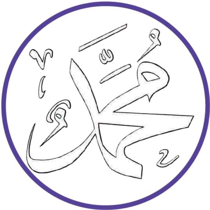
Gambar 7.9 Kaligrafi nabi Muhammad saw.

Aku senang mewarnai kaligrafi Nabi Muhammad saw.