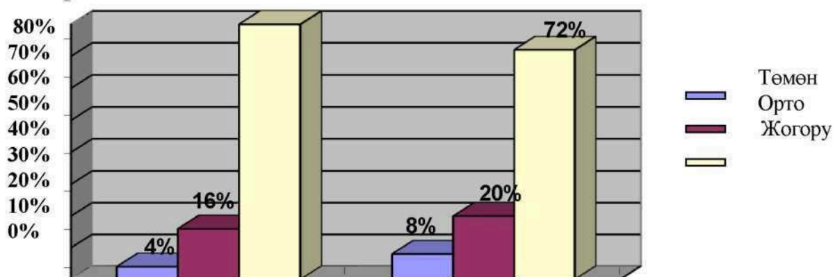
2-сүр. Кенже мектеп окуучуларынын үй-бүлө мүчөлөрүнүн өз ара түшүнүшүү деңгээли