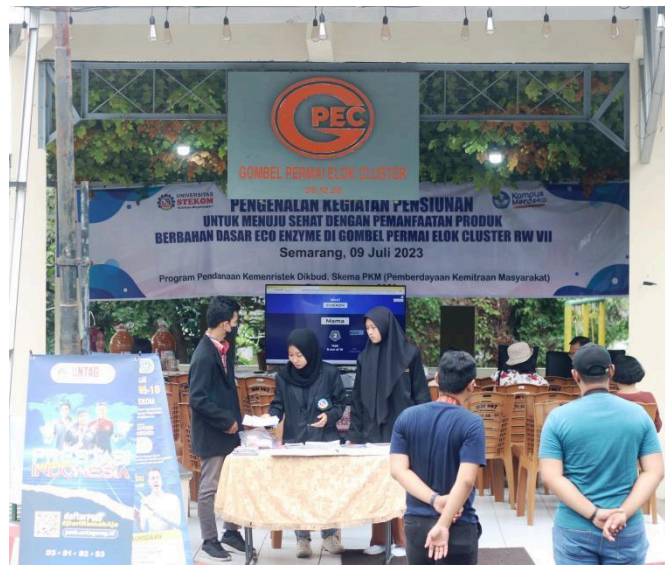
Gambar 1. Penyuluhan tentang manfaat Produk Eco