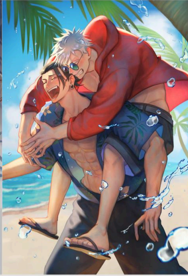
【上色草稿】 約80%效果預期