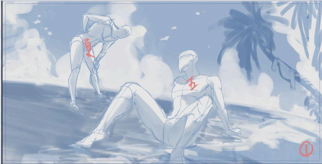
【單色構圖初稿】 標示物件位置/光影