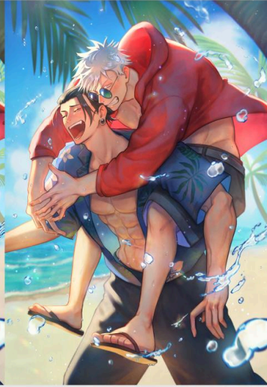
【完成圖】 色彩微調/效果後製及形狀修整