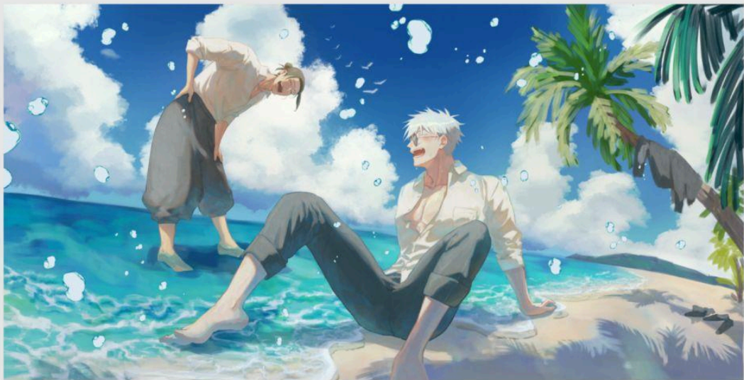
【上色草稿】 約80%效果預期