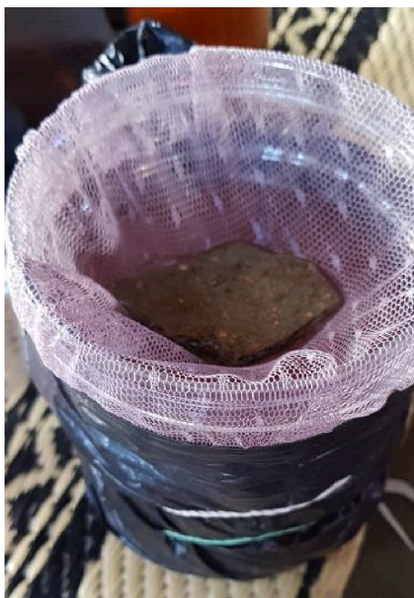
Gambar 1. Ecovitraps dalam rumah