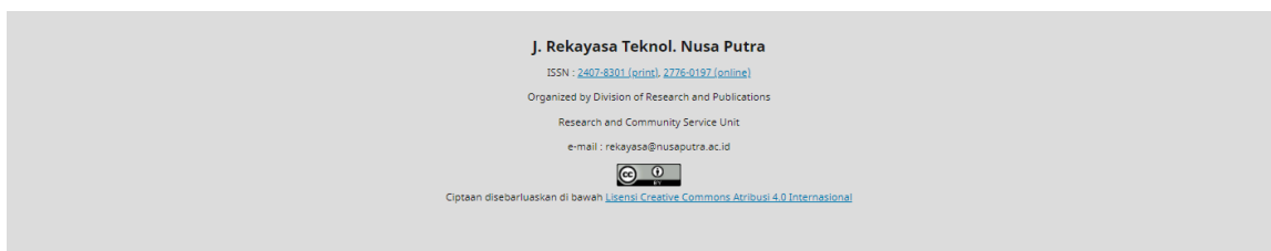
Gambar 1. Contoh gambar (gambar)

a. Sample of a Table footnote. (Table footnote)