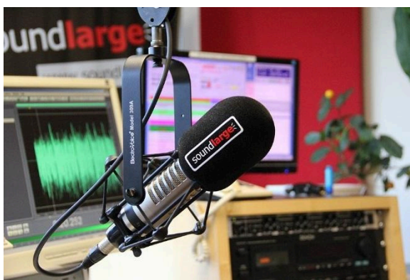
Obrázok 1 Štúdio v rádiu

Obrázky a grafy označujeme jednotným pojmom „Obrázok“. Popisok uvádzame pod vybraný objekt – Times New Roman, veľkosť 9, tučné písmo, čierna farba . Popisok vložíme pravým kliknutím myši a z ponuky vyberieme „Vložiť popis...“. Obrázky a grafy zarovnáваме na stred.