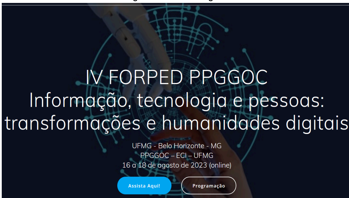
Figura 1: Título da figura

Recomenda-se o uso moderado e somente quando houver a necessidade de utilização de figuras, gráficos, ilustrações e/ou tabelas. Indica-se que essas representações visuais devem ser apresentadas com boa resolução para que seja possível visualizá-las com facilidade. Além disso, devem possuir título e fonte, conforme os exemplos a seguir: