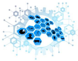
Gráfico 1: Título do gráfico