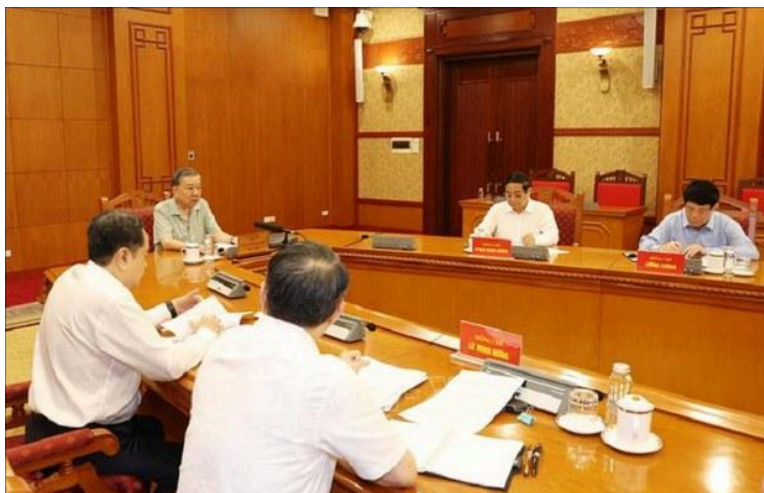
Cuộc họp Tiểu ban nhân sự Đại hội XIV của Đảng.