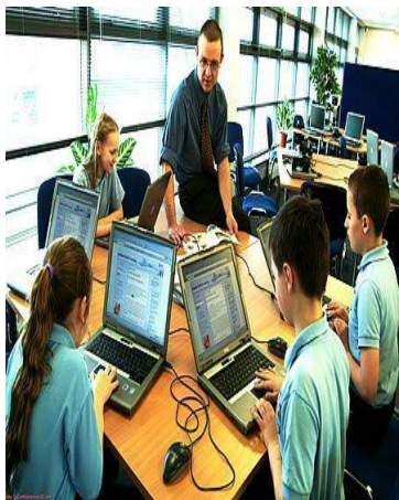
d).- sala de medios.