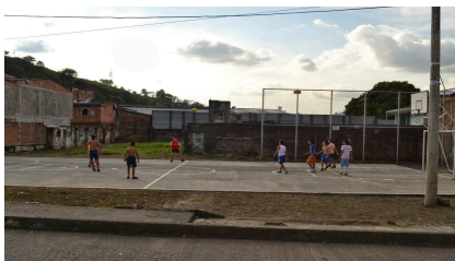
e).- cancha deportiva.