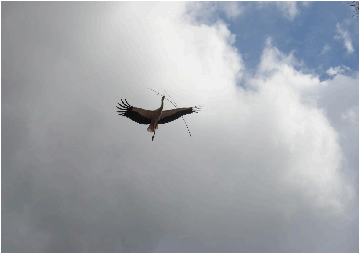
Ooievaar met nestmateriaal

ook enkele roofvogels waaronder Slangenarend, e.a. We picknicken in Napi. In de namiddag bezoeken we het museum van productie van olijfolie waar we de dag afsluiten.