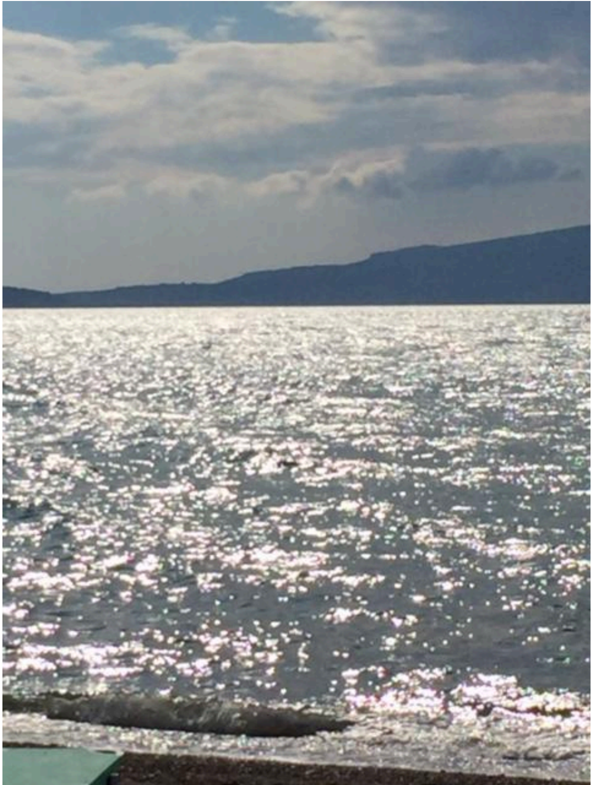
Zon op het water

Mooiste waarnemingen (Top 10 van 76 soorten) Vorkstaartplevier, Krombekstrandloper, Balkan Gele Kwikstaart, Graszanger, Griekse Spotvogel, Rosse Waaiersstaart, Krueper's (Turkse) Boomklever, Maskerklauwier, Europese Kanarie, Wespendif.