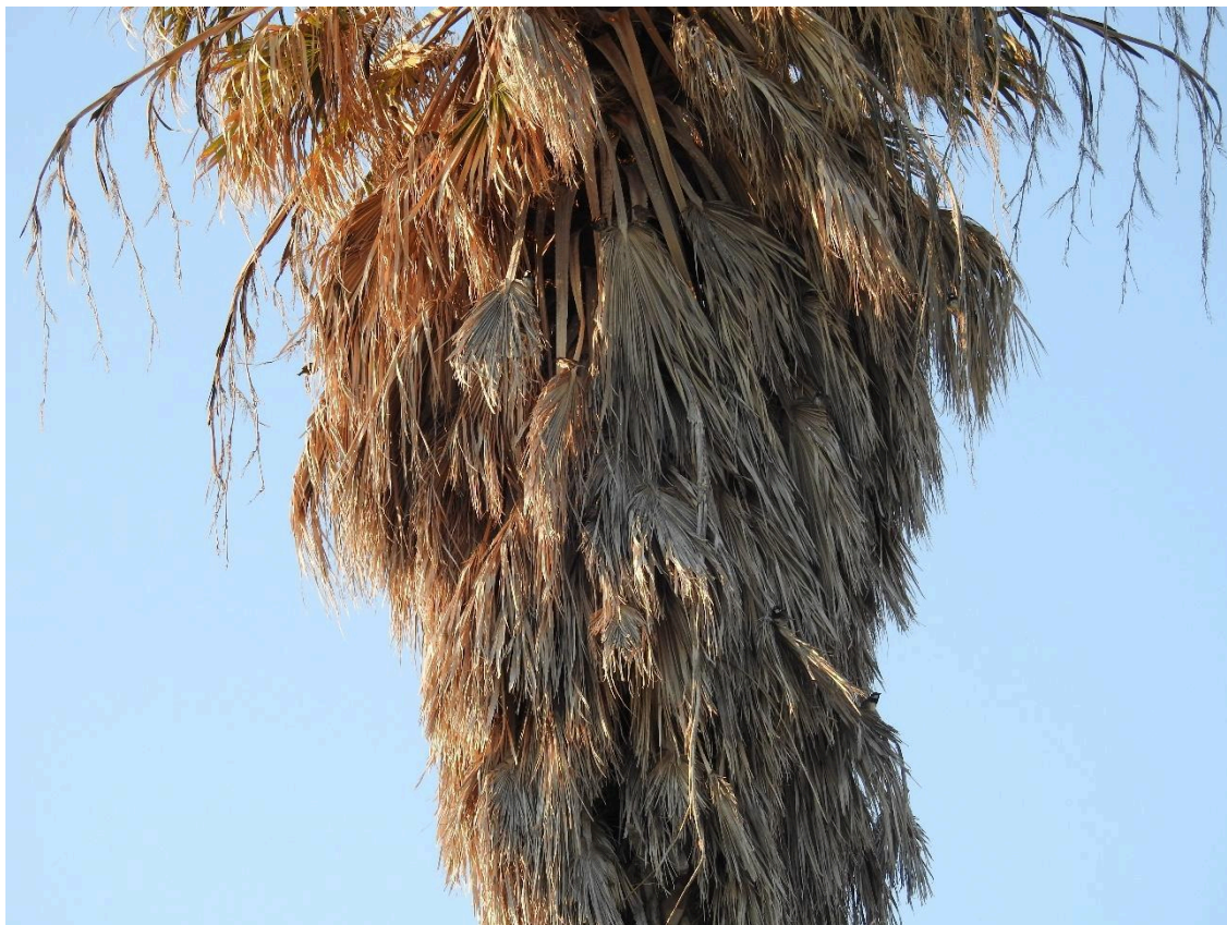
Palmboom vol Spaanse mussen