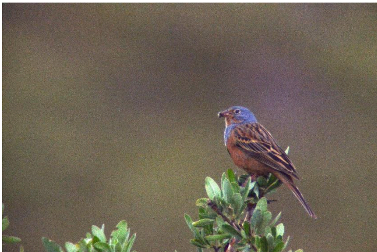
Bruinkeelortolaan (sterk ingezoomd)

Mooiste warnemingen: (Top 10 van 55 soorten) Kuifaalscholver, Zwarte Ooievaar, Zomertortel, Ruppel's Grasmus, Baardgrasmus, Kleine Zwartkop, Blonde Tapuit, Roodkopklauwier, Cirlgors, Bruinkeelortolaan.