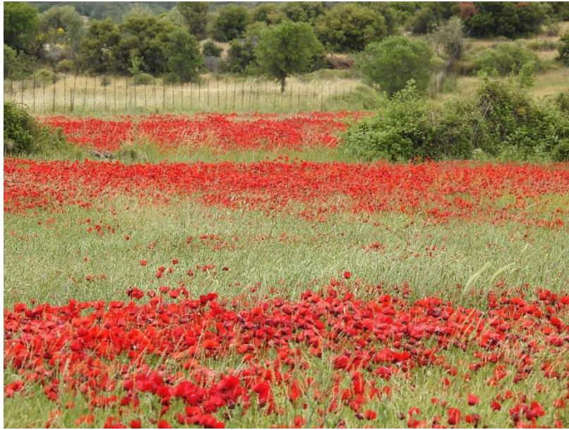
Klaprozen in overvloed