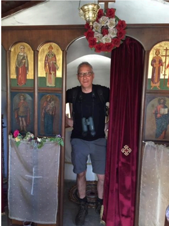
Een kleine witte kapel in Eresos (3m op 4m) ziet er van binnen anders uit dan onze kapelletjes

De ganse dag blijven we in de vallei met verschillende tussenstops.