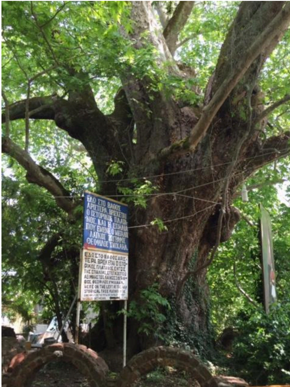
Picknicken bij een zeer oude boom in Agiassos

's Avonds vlucht naar Athene. Overnachting in een hotel aan de luchthaven.