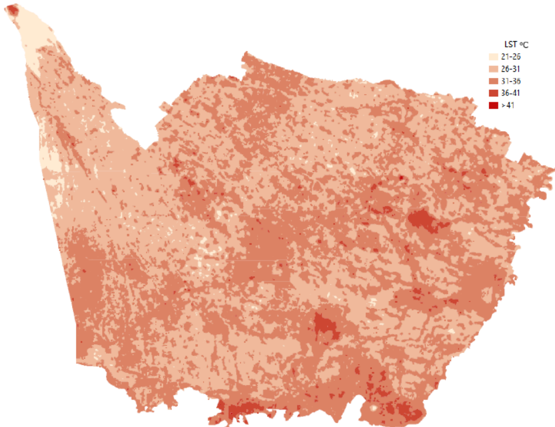
Gambar 2. Gambar dapat dijadikan 1 kolom agar terlihat detail