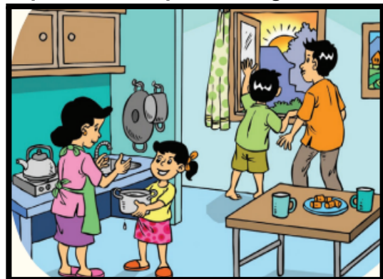
Sikap berbakti kepada orang tua dengan membantu membersihkan rumah