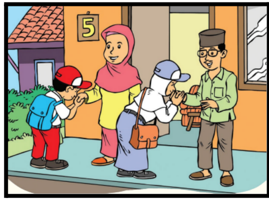
Sikap Berbakti Kepada Orang Tua dengan bersalaman sebelum pergi kesekolah