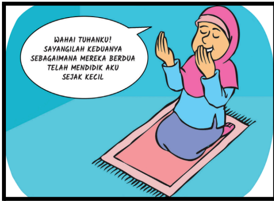
Sikap berbakti kepada orang tua dengan mendoakannya