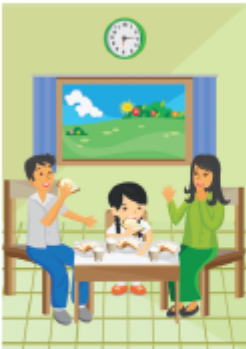
Cici's family have bread for breakfast.

2. Secara individu peserta didik mengucapkan kalimat yang sesuai gambar secara acak seperti yang dicontohkan guru di Buku Siswa halaman 28.