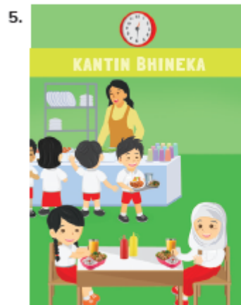
Aisyah and Cici have fried chicken and orange juice for lunch .