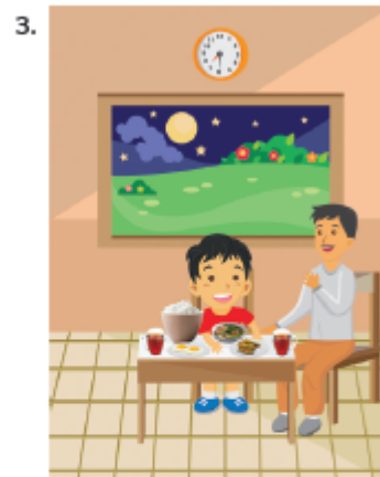
Made and his father have fried chicken , fried eggs , vegetable soup and tea for dinner .