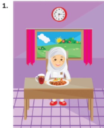
Aisyah has fried rice for breakfast .

4. Peserta didik menuliskan kata yang sesuai dengan gambar pada Buku Siswa halaman 39–41.