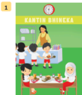
Aisyah and Cici have lunch in the canteen.

2. Peserta didik menuliskan waktu-waktu makan sesuai dengan gambar pada Buku Siswa halaman 26–27.