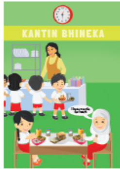
Cici and Aisyah have noodle for lunch.