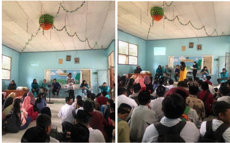
Gambar 2. Sesi Tanya Jawab.