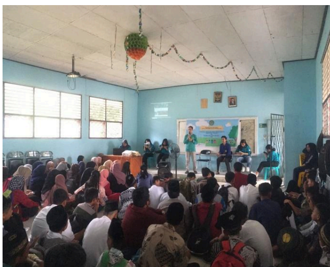
Gambar 1. Kegiatan Penyuluhan

Gambar yang dicantumkan pada naskah harus dengan kualitas yang baik. Gambar tidak berdiri sendiri dan harus merupakan bagian yang relevan dari naskah. Agar diperhatikan bahwa gambar bukan merupakan dokumentasi yang tidak terkait dengan pembahasan naskah. Patikan naskah tidak menampilkan gambar yang menunjukkan identitas maupun afiliasi para penulis.