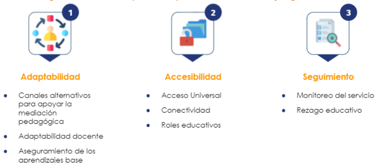
Figura N° 1 Elementos para la adaptabilidad, accesibilidad y seguimiento