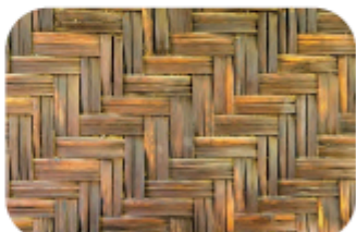
Gambar 4.8.5 Pola Pada Anyaman

Dapatkan kamu melihat bentuk yang berulang pada foto ini?