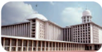
Gambar 4.8.6 Masjid Istiqlal

Dapatkan kamu melihat bentuk yang berulang pada foto ini?