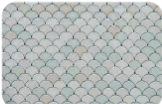
Gambar 4.8.3 Pola Sisik