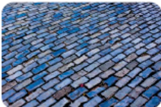
Gambar 4.8.2 Pola Persegi Panjang Diagonal