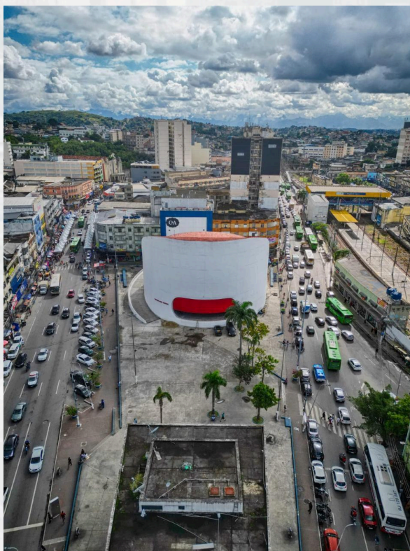
Figura 1: Fotografia do Centro de Duque de Caxias sob o olhar de Filipo Tardin. Legenda em TNR 10 e referenciada no texto como (Fig.1) Imagem centralizada, alinhada com o texto.

15.000 e máximo 20.000 caracteres com espaços, incluindo título, resumo e bibliografia formatado em fonte Times New Roman , tamanho 12, espaçamento entre linhas de 1,5 e alinhamento justificado.