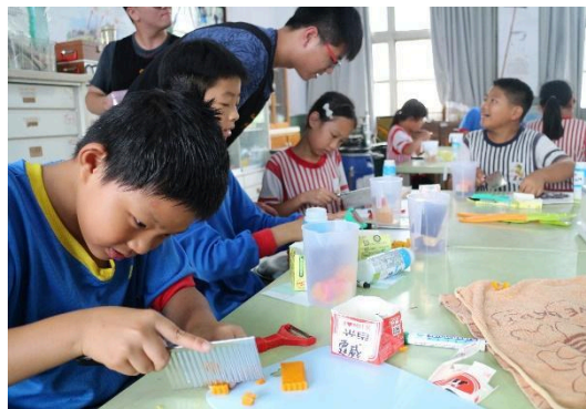
廢棄回收油做手工皂