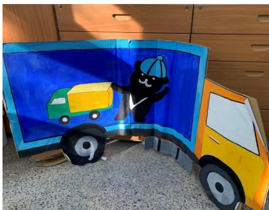
廢棄紙箱作為學生遊戲器材