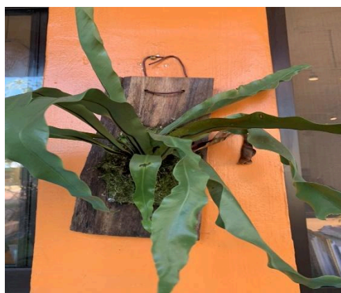
廢棄櫃子、木板作為擺放盆栽及園藝工具