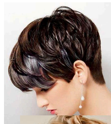
Рис. - Напівприлеглий силует

Для зручності силует інколи схематизують, наближаючи його до якоїсь геометричної фігури.