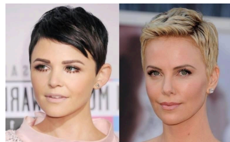
Рис. - Скульптурний або прилеглий силует

- скульптурний, або прилеглий силует повторює форму голови, відкриває як її переваги, так і недоліки;