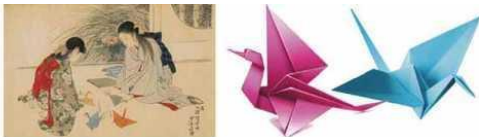
Мал. 287. Оригамі як засіб формоутворення

У монастирях з паперу вперше почали складати незвичайні фігурки-оригамі. Вони символізували різних богів. В особливих паперових коробочках приносили в храми дари (мал. 287).