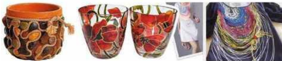
Мал. 276. Хаотичний спосіб розміщення декору

Хаотичний спосіб декору полягає в методі випадкового розміщення елементів оздоблення на виробі (мал. 276).