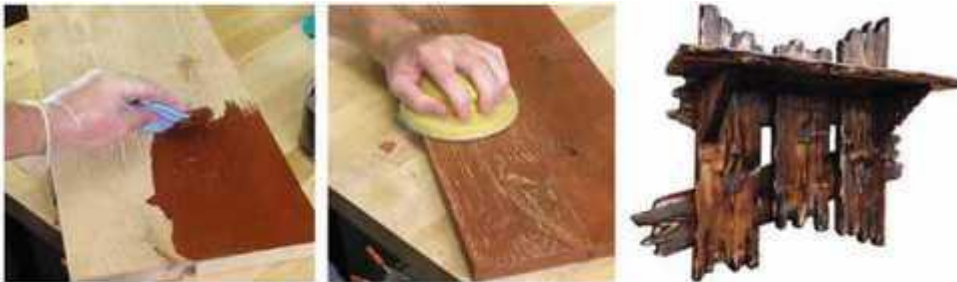
Мал. 282. Патинування деревини

Тканина в елементах декору може бути як однотонною, так і з малюнком. Її можна розписати власноруч і отримати оригінальну чудову річ в єдиному екземплярі. Так з'явилася техніка розпису на тканині - батик (мал. 283).