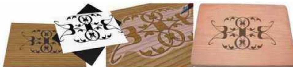
Мал. 279. Декорування за допомогою трафарету

Одним із досить простих видів декорування є нанесення на поверхню малюнка або орнаменту за допомогою трафарету (мал. 279). Для цього використовують лекало або трафарет, який можна виготовити самостійно і за його допомогою наносити оригінальний малюнок на будь-який виріб інтер'єрного призначення.