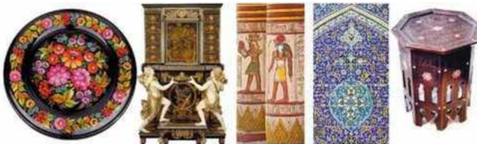
Мал. 273. Тотальний спосіб розміщення декору

У контрастному (ритмічному) способі декоративні елементи чергуються з ділянками не оздобленої декором поверхні (мал. 275).