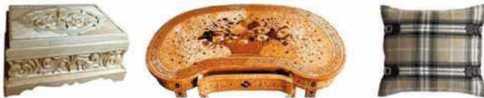
Мал. 275. Контрастний спосіб розміщення декору

Хаотичний спосіб декору полягає в методі випадкового розміщення елементів оздоблення на виробі (мал. 276).