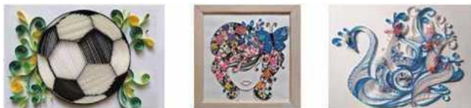
Мал. 288. Квілінг як засіб декорування

Черниці в монастирях використовували рвані шматочки бібeldруку (особливо тонкий непрозорий папір) та гусяче пір'я, щоб прикрасити релігійні догмати та картини. Саме використання гусячого пір'я породило термін quilling (квілінг) (мал. 288). Сьогодні це ще одна нова техніка, що додає інтер'єру вишуканості. Ніби філігранне паперове мереживо, графічний малюнок поєднується з колірною варіативністю.