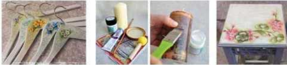
Мал. 281. Декорування виробів декупажем

Слово decoupage французького походження, означає «вирізати». Отже, техніка декупажу - техніка прикрашання, декорування, оформлення виробів за допомогою вирізаних паперових мотивів. Її винайшли китайські селяни у XII ст., саме вони зробили тонкий барвистий папір і стали прикрашати за його допомогою різні предмети. До Європи цей метод декорування прийшов у XVII-XVIII ст. разом з красивими лаковими китайськими меблями.