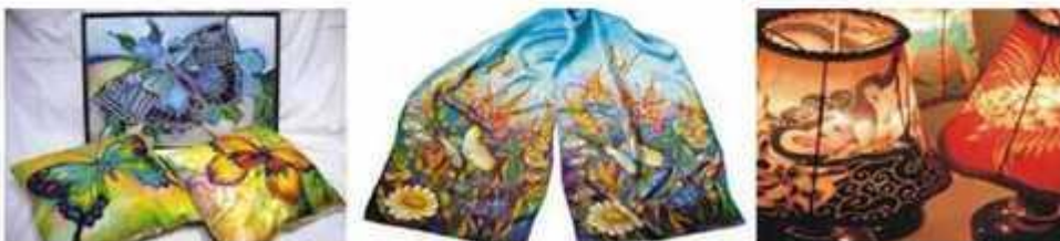
Мал. 283. Вироби, декоровані батиком

Сучасний розпис має три популярні варіації виконання: холодний, гарячий, вузликовий батик.