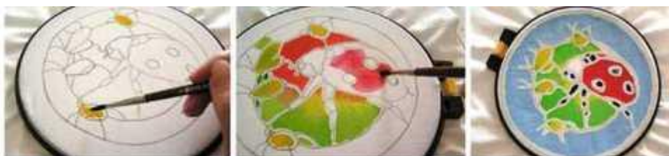
Мал. 284. Технологія виконання батику

Контур малюнка, що наноситься, обов'язково повинен бути замкнутим. Коли він замкнеться, слід почекати деякий час - контур повинен висохнути. Зазвичай на флаконі з резервуючою рідиною зазначено час її висихання. Після висихання контуру можна приступати безпосередньо до розпису тканини кольоровими фарбами (мал. 284).