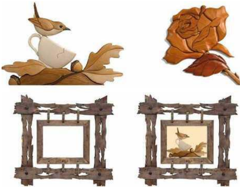
Виготовлення панно. Інтарсія