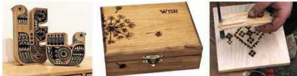
Мал. 278. Термічне декорування деревини

Одним із досить простих видів декорування є нанесення на поверхню малюнка або орнаменту за допомогою трафарету (мал. 279). Для цього використовують лекало або трафарет, який можна виготовити самостійно і за його допомогою наносити оригінальний малюнок на будь-який виріб інтер'єрного призначення.