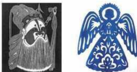
Мал. 286. Витинанки-обереги для вікон

У Китаї витинанки наклеювали на вікна. Це були вирізані з паперу зображення богів, духів, героїв та персонажів народних легенд (мал. 286). Існувало вірування, що такі зображення оберігають будинок від злих духів і ворогів.