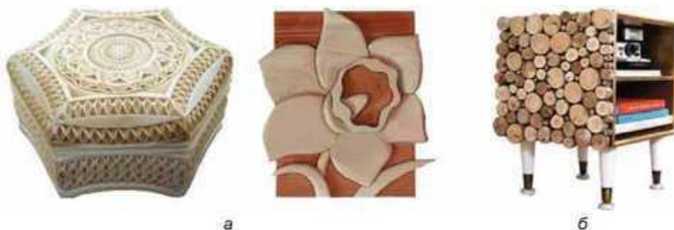
Мал. 277. Способи нанесення декору

За способом послідовності виконання роботи декорування можна виконувати двома способами: наносити декор безпосередньо на конструктивні елементи виробу (мал. 277, а) та окремо, виготовляючи декоративні елементи, які потім кріпити до виробу (мал. 277, б) (накладний декор).