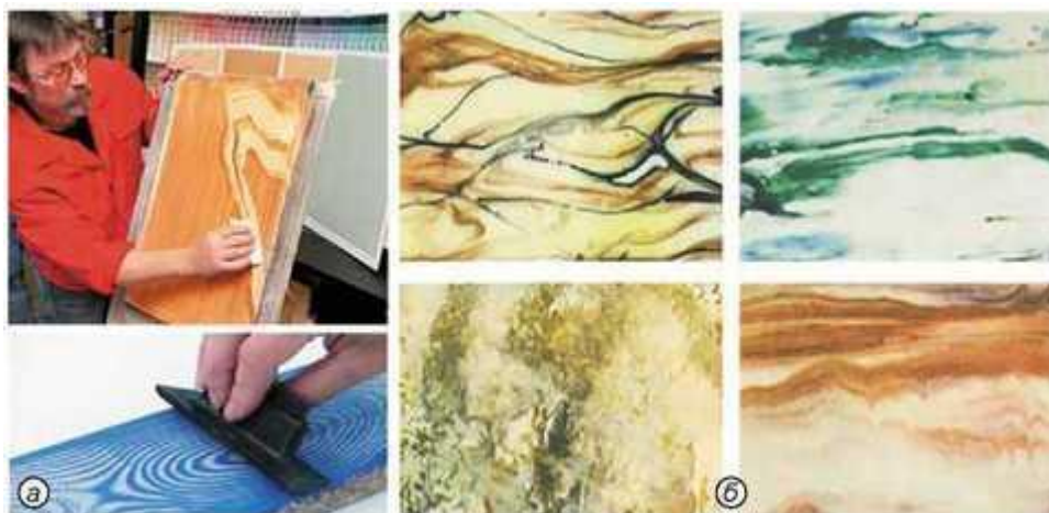
Мал. 280. Імітація: а – фактури дерева; б – текстури матеріалів

Імітація фактури й текстури - це перенесення якісних візуальних ознак з одного предмета (об'єкта) на інший для створення або досягнення необхідного ефекту (мал. 280). Найчастіше використовується дизайнерами в інтер'єрах для творчих цілей або для здешевлення процесу виготовлення того чи іншого об'єкта (наприклад, нанесення фактури дерева на ПВХ).