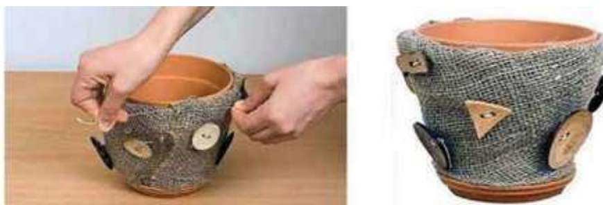
Мал. 285. Робота в стилі «хенд-мейду»

Багато хто сьогодні обирає «хенд-мейд» - декор, що зроблений власноруч. Для цього використовують безліч підручних матеріалів, поєднання яких у кінцевому підсумку дає оригінальний ефект. За допомогою мішківини та ґудзиків можна створити оригінальний сільський «костюмчик» для глечика під вазон (мал. 285).