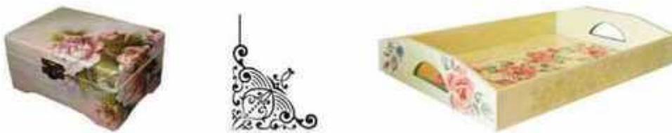
Мал. 274. Локальний спосіб розміщення декору

У тотальному способі розміщення декор заповнює всю площину виробу, що декорується (мал. 273).