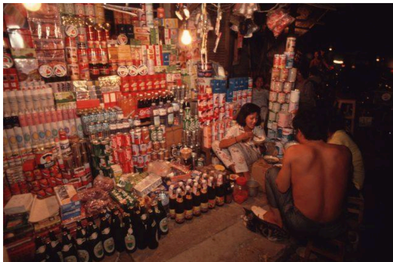
Chợ trời Sài Gòn 1990