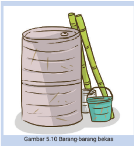
Gambar 5.10 Barang-barang bekas

Pak Made dan keluarganya harus melakukan ibadah pagi terlebih dahulu di Pura pada Minggu ini. Sementara itu, warga yang lain bekerja sejak pagi bergotong royong menyiapkan tempat sampah baru. Ujang, Siti, dan Edi membantu Pak Budi bersama beberapa warga lain menganyam bilah-bilah bambu menjadi keranjang sampah organik. Keranjang ini akan menjadi tempat sampah dari kebun, seperti daun-daun kering, batang, atau buah yang berjatuhan di bawah pohon.