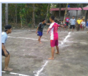
Gambar 5.8 Permainan Gobak Sodor

Para pemain dibagi menjadi 2 kelompok, yakni tim serang dan tim jaga. Setiap tim memilih ketua yang bertugas sebagai sodor dari salah satu anggotanya. Tim serang berkumpul semuanya di pangkalan dan tim jaga bersiap diri di garis-garis pertahanan (melintang) yang telah dipilih oleh ketuanya. Tim serang harus berusaha masuk dan melewati petak-petak tanpa tersentuh tim jaga sehingga dapat berada di belakang garis. Kemudian, akan berusaha kembali lagi ke pangkalan. Jika seorang pemain tim serang bisa kembali lagi ke pangkalan tanpa tersentuh oleh tim jaga maka tim serang yang dinyatakan sebagai pemenang lalu mendapatkan poin.