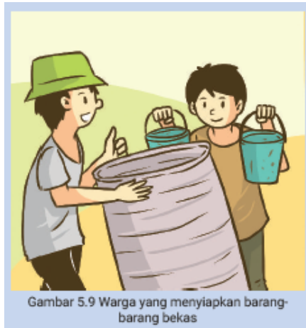
Gambar 5.9 Warga yang menyiapkan barang-barang bekas