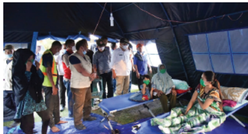
Gambar 5.12 Posko Korban Bencana Alam

Ceritakan kaitan gambar berikut ini dengan kegiatan pembelajaran saat ini di depan kelas!