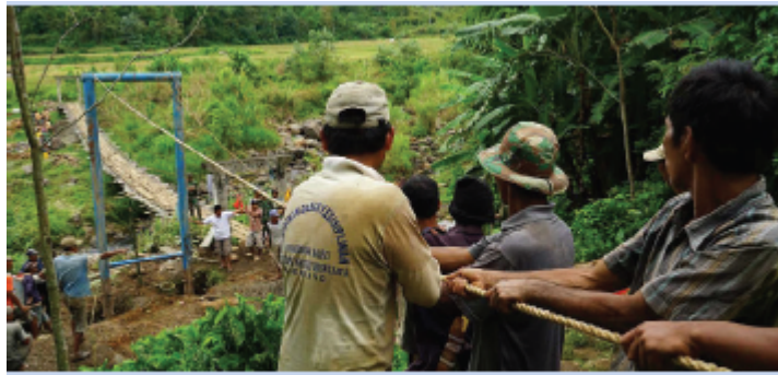
Gambar 5.15 Gotong Royong membangun jembatan