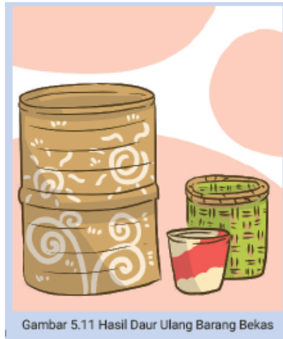
Gambar 5.11 Hasil Daur Ulang Barang Bekas