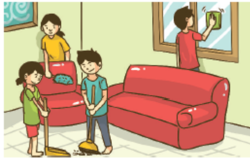
Gambar 5.2 Anak dan orang tua begotong royong membersihkan rumah.

Perhatikanlah gambar berikut ini. Kemudian, ceritakan dan jelaskan yang kamu ketahui di depan kelas.