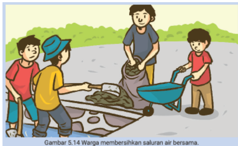
Gambar 5.14 Warga membersihkan saluran air bersama.

Dalam menghadapi musim hujan yang hampir tiba, warga masyarakat Kelurahan Tanah Baru berkumpul dan berdiskusi untuk mengadakan kerja bakti. Mereka berencana membersihkan saluran air karena mereka yakin dan sepakat jika saluran air bersih, perumahan warga tidak akan banjir.