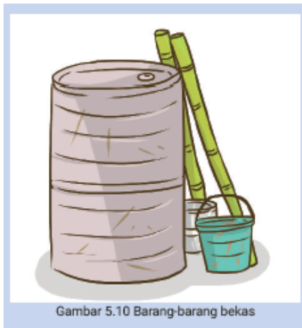
Gambar 5.10 Barang-barang bekas