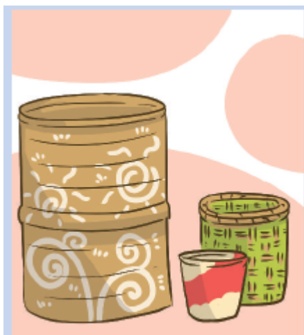
Gambar 5.11 Hasil Daur Ulang Barang Bekas

Sekitar pukul 09.00, Pak Made, Dayu, dan keluarganya sudah kembali dari kegiatan ibadah. Tong-tong sampah baru sudah hampir selesai dan siap untuk dihias. Pak Made dan istrinya, serta Dayu berkeliling membuat pola hiasan untuk tong sampah baru. Lina ikut serta membantu Dayu. Setelah itu, warga bergotong royong mengecat dan mem-perindah hiasan tempat sampah. Sebelum matahari meninggi, sudah ada 15 tong sampah baru yang dihasilkan warga secara bergotong royong. Semua barang bekas seperti drum, ember, dan karung plastik, sudah berubah menjadi keranjang anyam dan tempat sampah yang cantik.