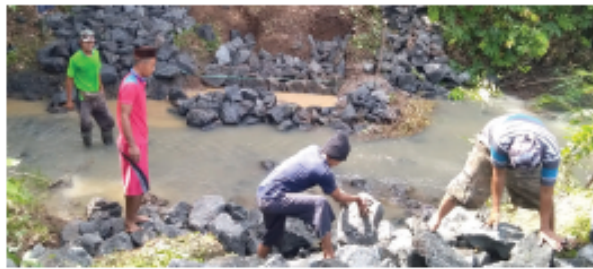
Gambar 5.6 Masyarakat sedang kerja bakti membangun jembatan

Ceritakan kaitan gambar berikut ini dengan kegiatan pembelajaran saat ini di depan kelas!