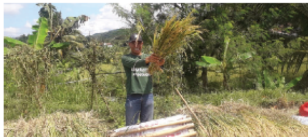
Gambar 5.7 Petani sedang memanen padi