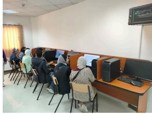
معامل حاسب حديثة مجهزة بأحدث الأجهزة و طابعة ثلاثية الابعاد لطباعه النماذج الخاصه بمشاريع الطلبة