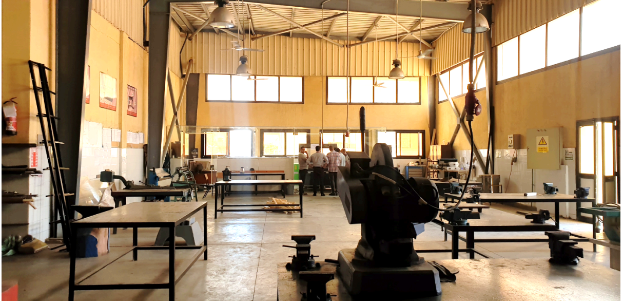
صور من الورشة