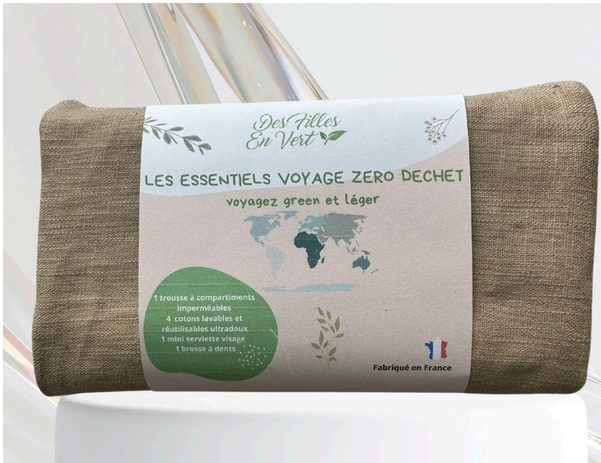
Trousse en lin imperméable posée sur une table

ALT : Trousse en lin imperméable zéro déchet pour voyage et salle de bain