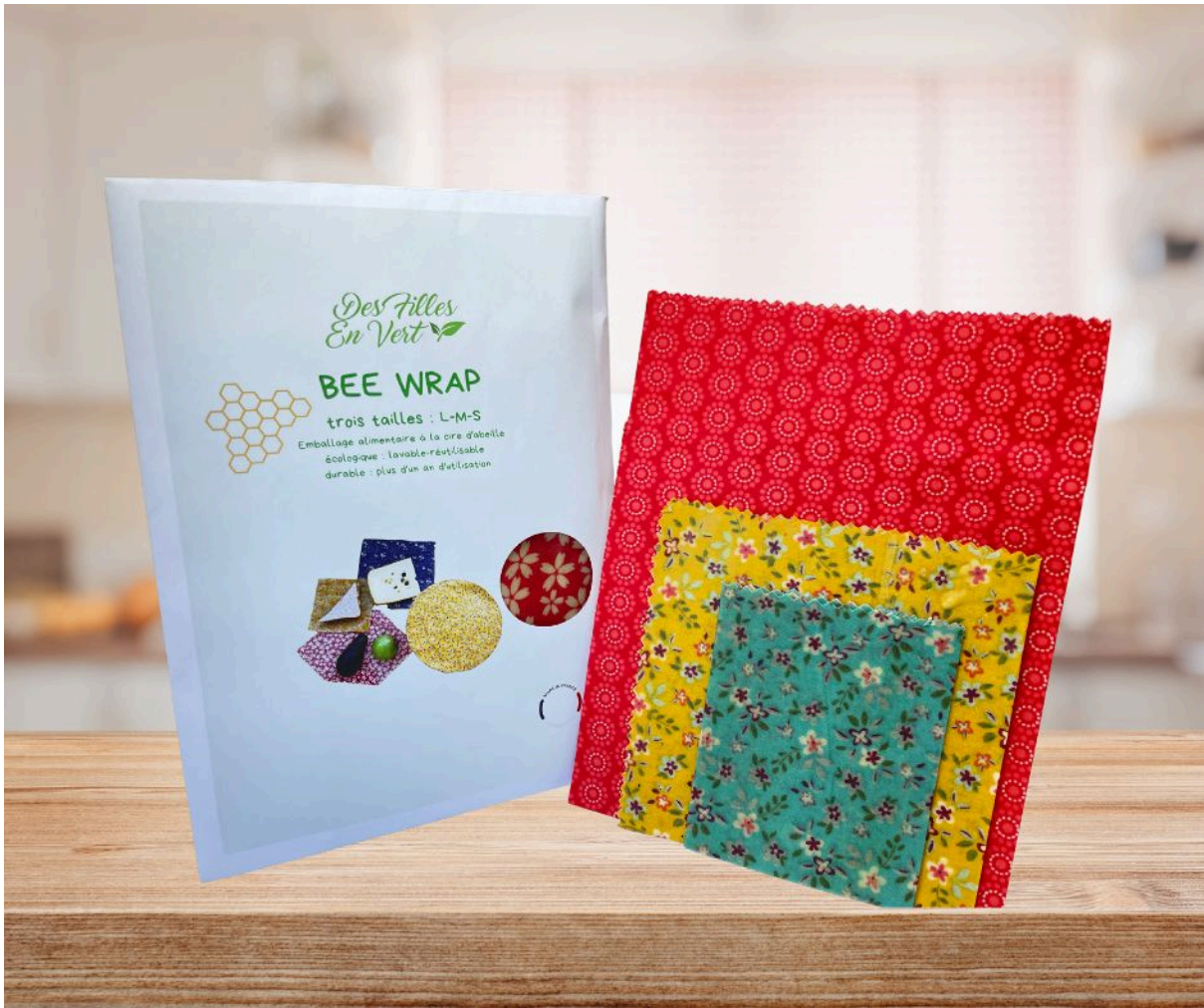
Bee wrap bio enveloppant un bol

ALT : Bee wrap bio réutilisable pour emballage alimentaire zéro plastique