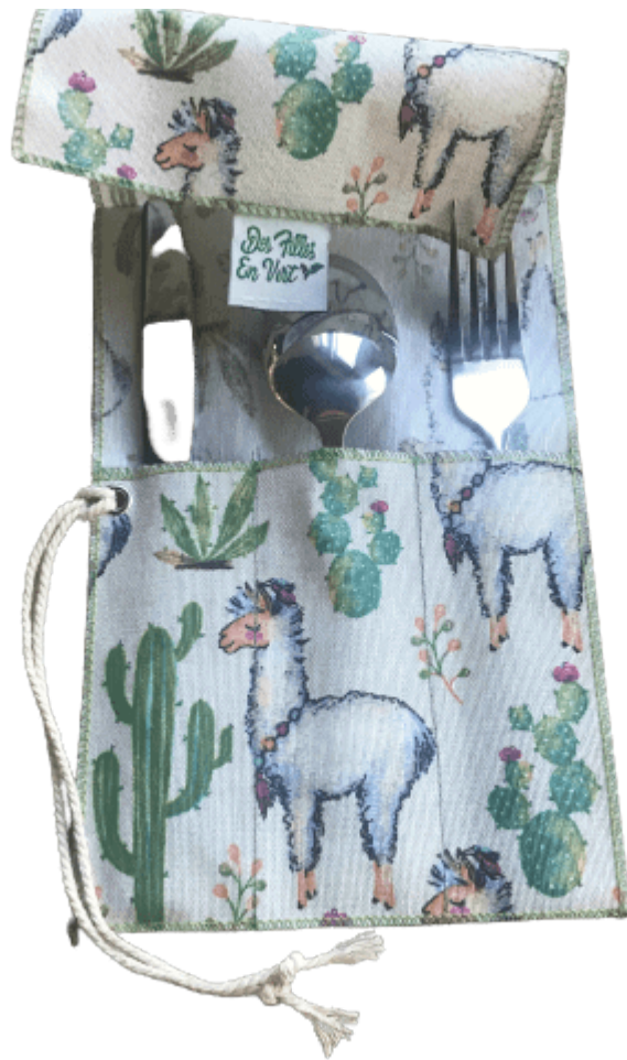
Étui à couverts imperméable ouvert avec couverts ALT : Étui à couverts imperméable réutilisable pour repas zéro déchet