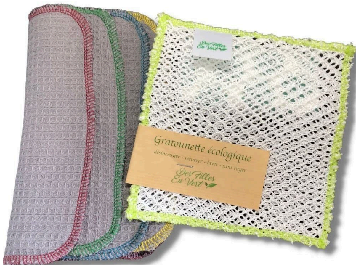
Kit ménage écologique avec lavettes et éponges ALT : Kit ménage éco-responsable lavable et durable