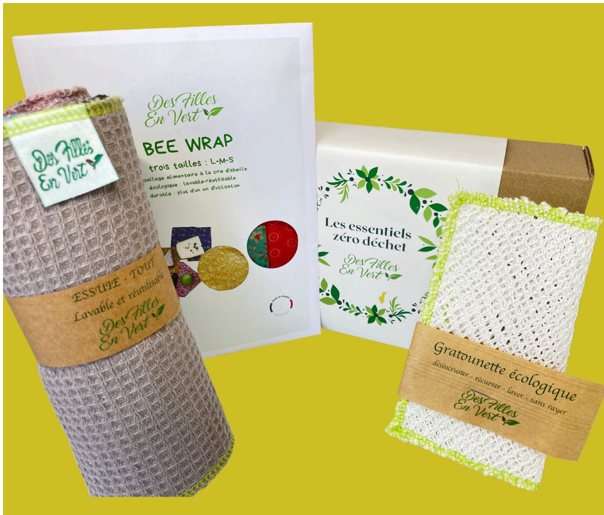
Coffret cuisine zéro déchet avec plusieurs produits ALT : Coffret cuisine zéro déchet complet pour une maison écologique