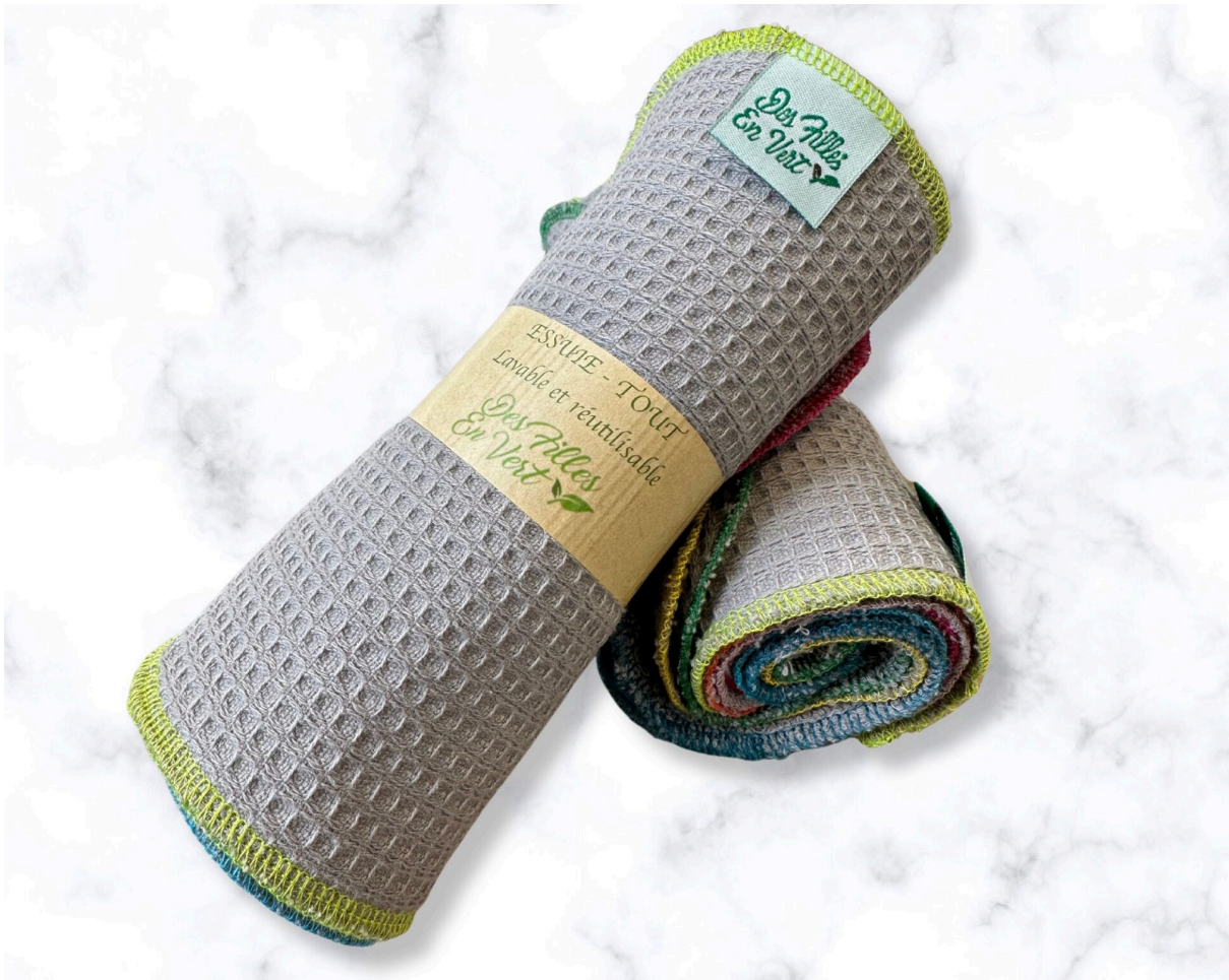
Essuie-tout lavable plié sur une table

L'essuie-tout lavable remplace les rouleaux jetables. Composé de plusieurs feuilles lavables, il est ultra absorbant et durable, idéal pour nettoyer sans générer de déchets plastiques.