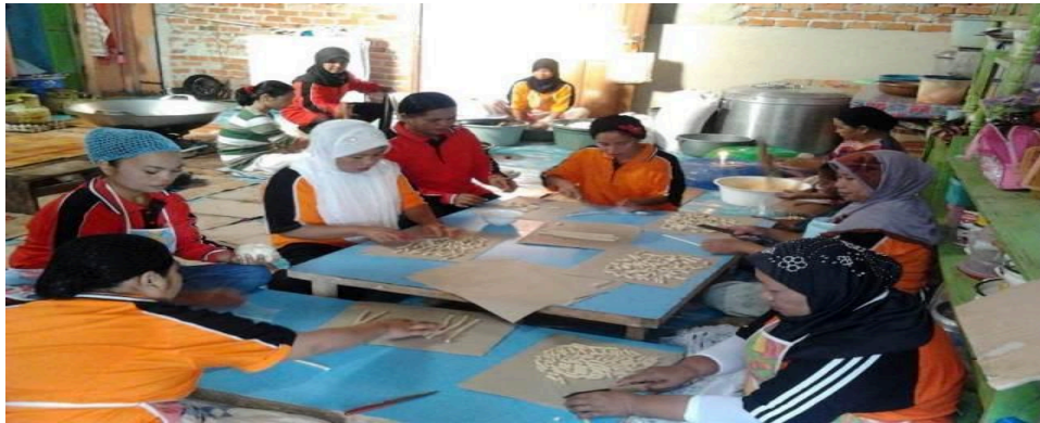
Gambar 1. Pemberdayaan Perempuan (10 pt, Normal)