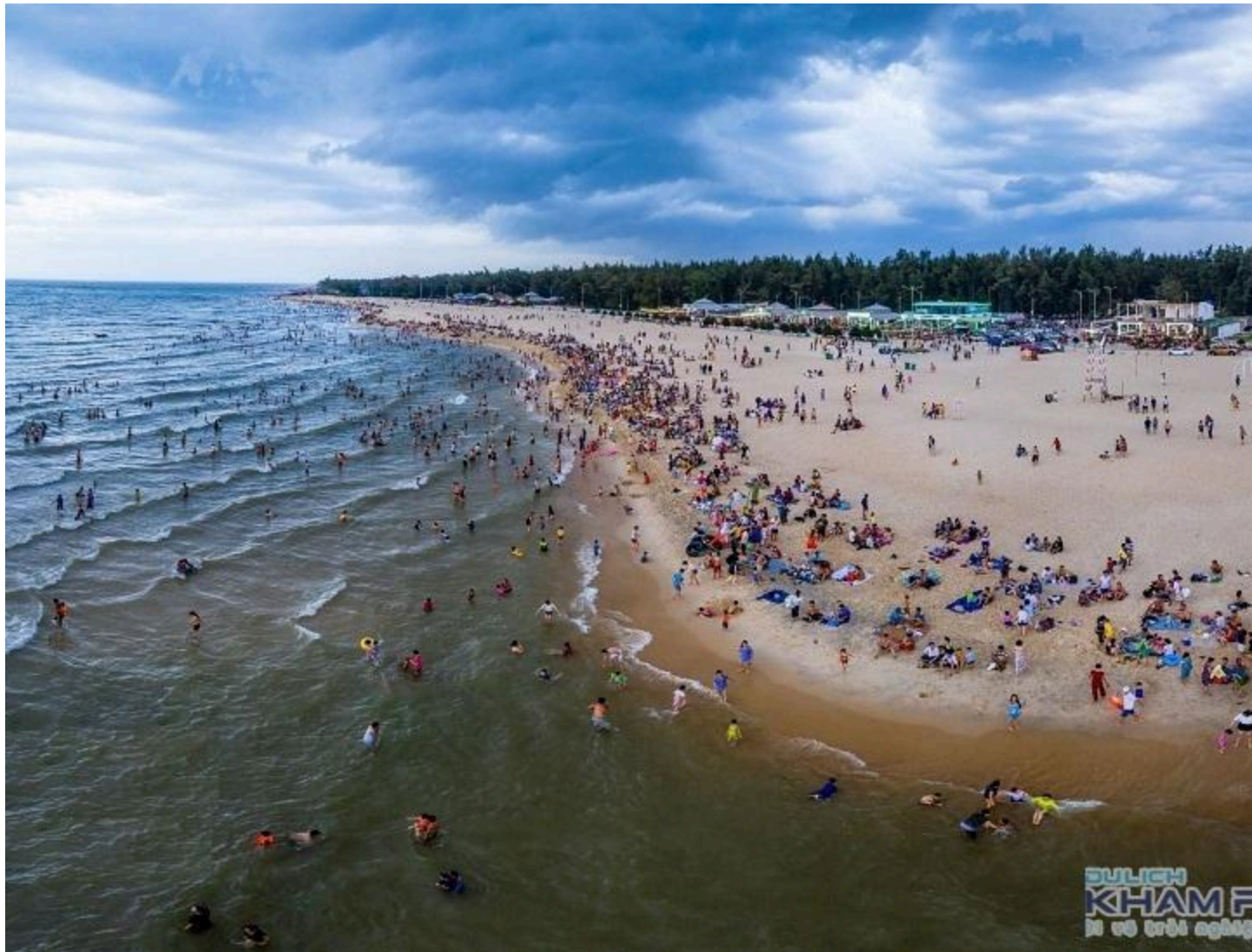
Hình ảnh biển Thuận An vào mùa cao điểm, cực kỳ đông đúc.

Để có thể tận hưởng trọn vẹn mọi trải nghiệm trên biển Thuận An Huế, bạn nên lưu ý đi vào mùa hè. Thời điểm lý tưởng nhất là từ tháng 4 đến tháng 8. Vào thời điểm này, thời tiết ở Huế khá đẹp, không nắng nóng như thành phố Đà Nẵng và Hội An mà khá mát mẻ, nhẹ nhàng. Các bạn cũng lưu ý là vào khoảng tháng 7, tháng 8 ở Huế thỉnh thoảng có bão, các bạn nhớ xem thời tiết thế nào rồi hãy đi nhé.