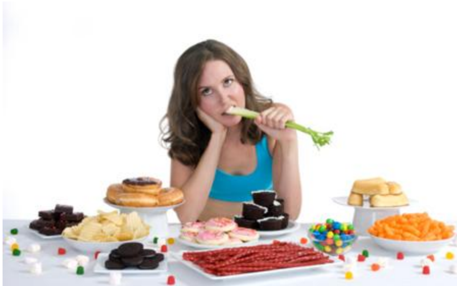
diet hell Lưu ý

Sản phẩm này không phải là thuốc, không có tác dụng thay thế thuốc chữa bệnh, hiệu quả sử dụng sản phẩm tùy thuộc vào cơ địa của mỗi người.