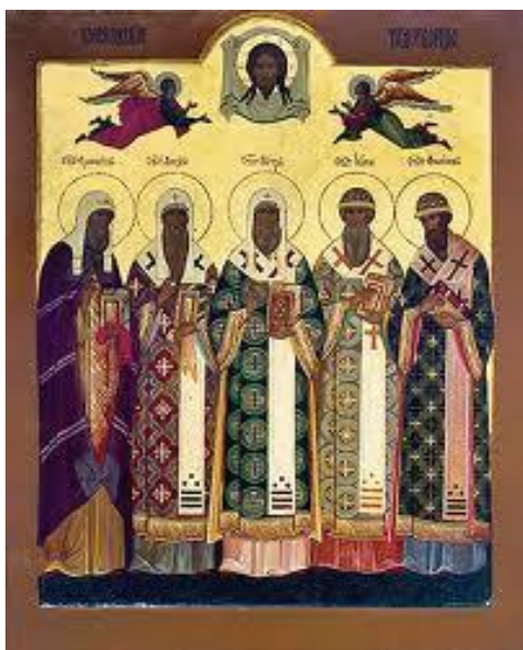
Святители Земли Русской