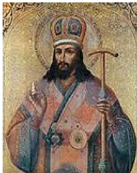
Святитель Димитрий, митрополит Ростовский