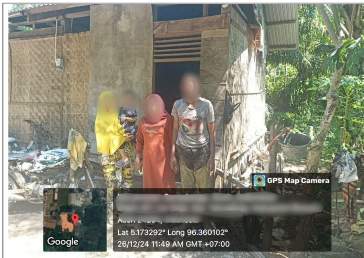
FOTO RUMAH TEMPAT TINGGAL SESUAI ALAMAT DOMISILI

Contoh Foto Geotagging (Sesuai Alamat Panti Asuhan) (baik yang tinggal dengan orang tua, tidak tinggal dengan keluarga inti, Anak Panti, maupun yang karena perpindahan tugas orang tua/wali)