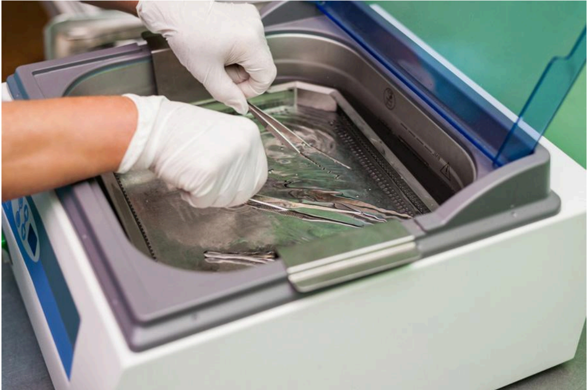
Sát khuẩn bộ dụng cụ nối mi

Mặc dù nối mi là một dịch vụ làm đẹp không xâm lấn. Nhưng vệ sinh dụng cụ nối mi luôn là bước không thể thiếu trong quy trình nối mi. Dụng cụ phải được khử trùng và làm sạch để vi khuẩn từ dụng cụ không lây lan qua dụng cụ nối mi.