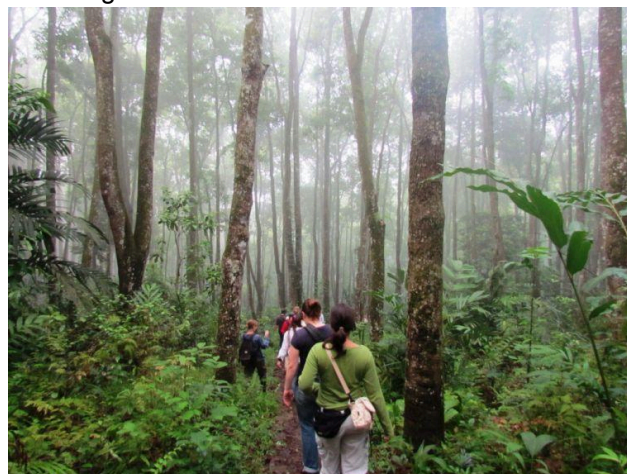
Gambar 1. Example of image

Format gambar dan penulisan judul gambar seperti pada contoh Gambar 1. Sebutkan juga sumber gambar.