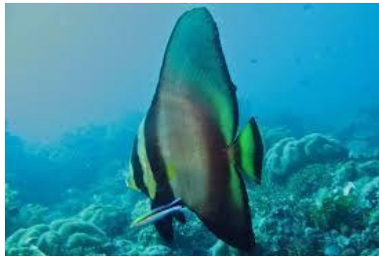
Gambar 1. Jenis ikan Platax (nama ilmiah) Arial 10

Apabila ingin menyajikan gambar, grafik dan tabel, mengikuti format pada gambar 1, 2, 3 dst, demikian juga dengan gambar.