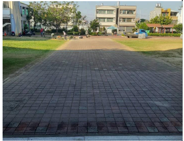
磚道為透水性鋪面