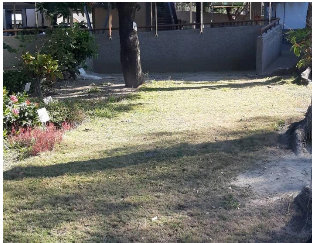
操場周邊種滿樹及草皮