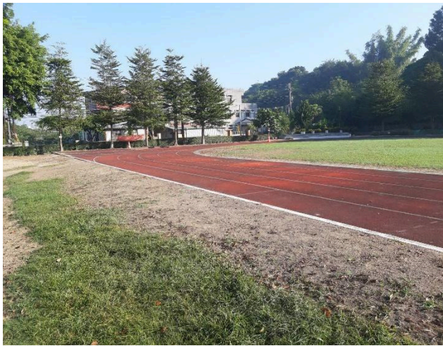
操場、跑道皆為透水區