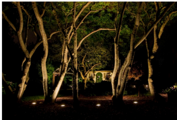
Рис. 7. Світильники Uplights

– Світильники Uplights. Такі моделі направляють світло знизу вгору. Їх застосовують в основному для оформлення та підсвічування будівель, чагарників, дерев, козирків, дахів, архітектурних елементів. Візуально такі моделі нагадують плями світла (рис. 7).