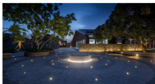
Рис. 15. Збалансоване освітлення ділянки