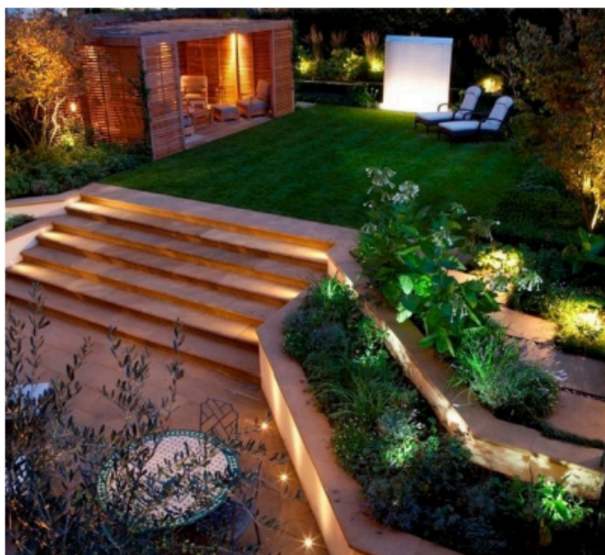
Рис. 11. Підсвічування сходів

– Плануючи гармонійний ландшафтний дизайн, необхідно передбачити висвітлення всіх сходів будинку (рис. 11).