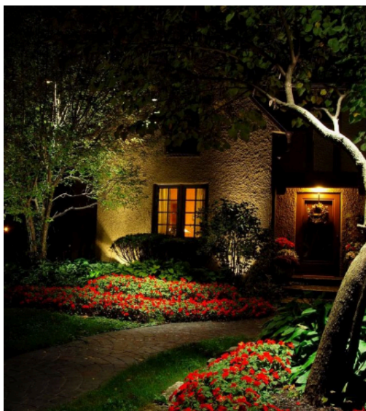
Рис. 13. Використання різнорівневих освітлювальних елементів; освітлення «острівцями»