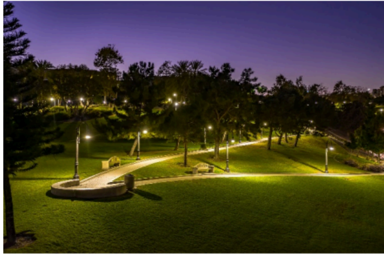
Рис. 5. Світлодизайн парку

Для освітлення території призначені спеціальні паркові ліхтарі. Вони виробляються в різноманітних стилях. Це дозволяє власникам навіть з найвишуканішим смаком підібрати необхідні світильники. Однак такі елементи, скоріше, є денним декором, адже розглянути вночі дизайн ліхтаря досить складно. Таким чином, щоб створити гармонійне ландшафтне освітлення, світильники слід підбирати спеціального типу. Найчастіше використовують такі види: – Світильники Downlights. Такі моделі застосовуються для підсвічування об'єктів. Вони чудово виконують роль чергового освітлення. Проте, використовуючи такі моделі, слід враховувати, що вони забезпечують потужний променистий потік світла. В деяких випадках це може бути навіть небезпечно. Наприклад, якщо поряд знаходиться дорога, якою проїжджають автомобілі. Краще всього підбирати малопотужні моделі, що володіють м'яким розсіяним потоком світла (рис. 6).