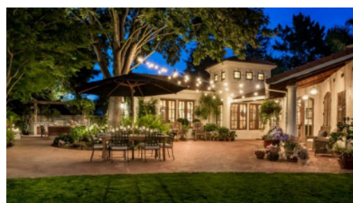
Рис. 16. Збалансоване освітлення ділянки