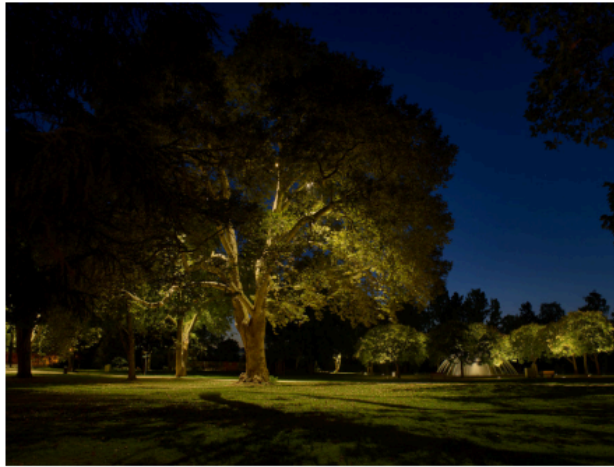
Рис. 6. Світильники Downlights

– Світильники Uplights. Такі моделі направляють світло знизу вгору. Їх застосовують в основному для оформлення та підсвічування будівель, чагарників, дерев, козирків, дахів, архітектурних елементів. Візуально такі моделі нагадують плями світла (рис. 7).