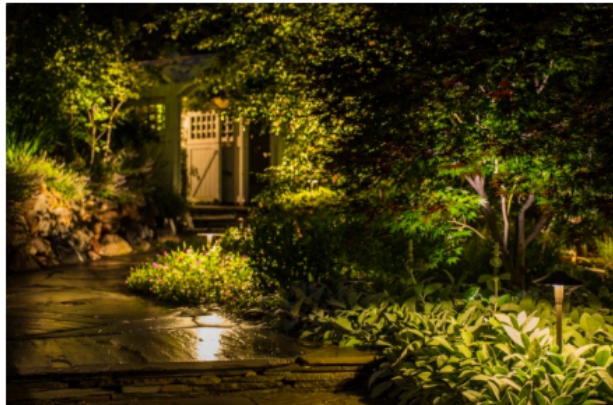
Рис. 4. Збалансоване освітлення

будівлі, для мешканців будинку та їх гостей психологічно легше пересуватися від більш темного місця до ділянки з яскравим освітленням, при цьому слід взяти до уваги і комфорт тих, хто перебуває всередині (Рис. 3); – ще одним фактором психологічного комфорту є те, що навіть в найтемніший час доби межі двору або ділянки проглядаються;