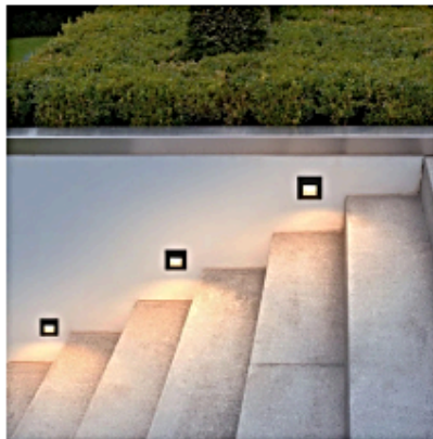
Рис. 9. Вбудовані світильники (підсвічування сходів)

– Підводні світильники. Спеціальні моделі, що володіють певним класом захисту. Вони здатні працювати довгий час під водою. Їх застосовують для освітлення водойм та фонтанів (рис. 10).