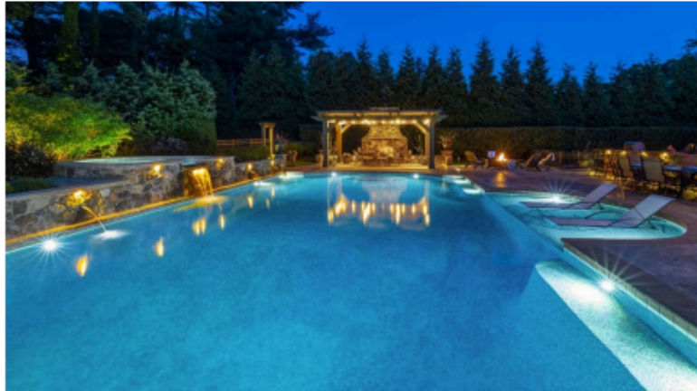
Рис. 12. Освітлення водойм кольоровим світлом

різноманітних моделей світильників: звичайні, підвісні, вбудовані, настінні (рис. 13).