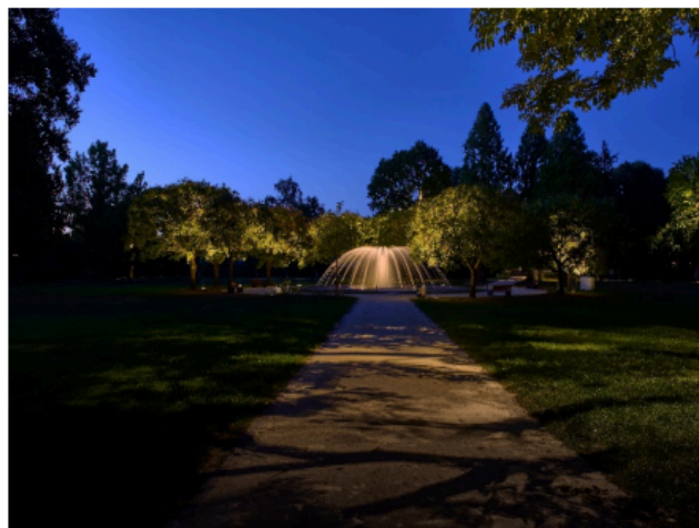
Рис. 10. Освітлення фонтану

– Підводні світильники. Спеціальні моделі, що володіють певним класом захисту. Вони здатні працювати довгий час під водою. Їх застосовують для освітлення водойм та фонтанів (рис. 10).