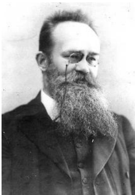
Мал. 2. М. Грушевський.