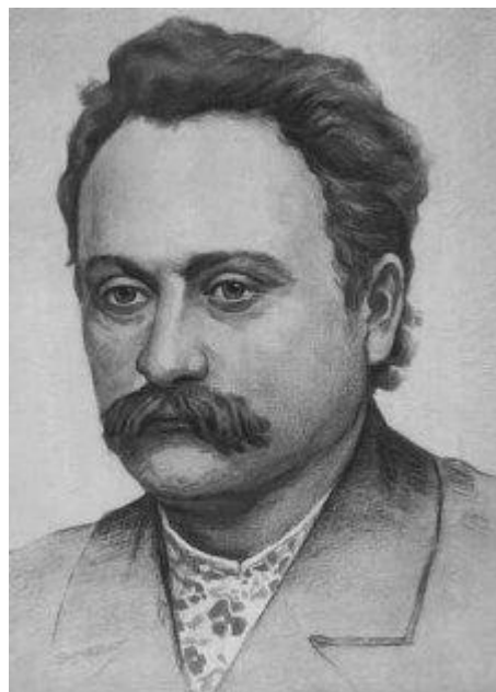
Мал. 3. І. Франко.