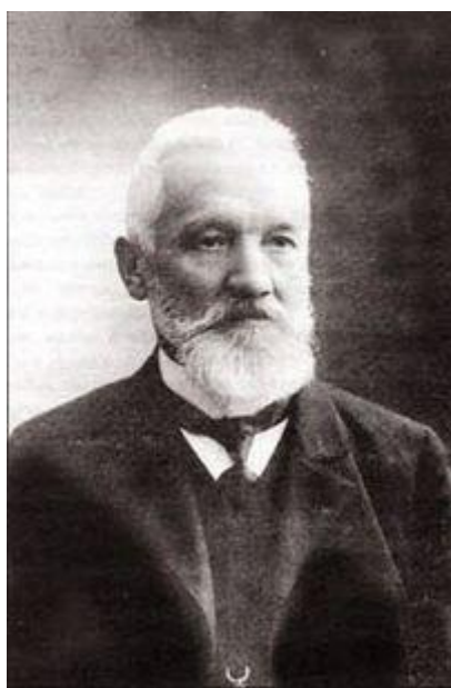
Мал. 5. В. Нагірний.

Наприкінці XIX – початку XX ст. на теренах Західної України почали виникати різні молодіжні організації. Так, 11 лютого 1894 р. В. Нагірний заснував у Львові спортивне товариство «Сокіл». 5 травня 1900 р. в с. Завалля Снятинського повіту К. Трильовський створив спортивно-пожежне товариство «Січ». А щоб проводити військове навчання, учні львівських середніх шкіл у 1911 р. створили таємний гурток «Пласт» . Військове навчання молоді здійснювало також утворене у 1912 р. товариство «Січові стрільці» . Ці гуртки виникли на базі ідейної підготовки галицької молоді до боротьби за незалежність.